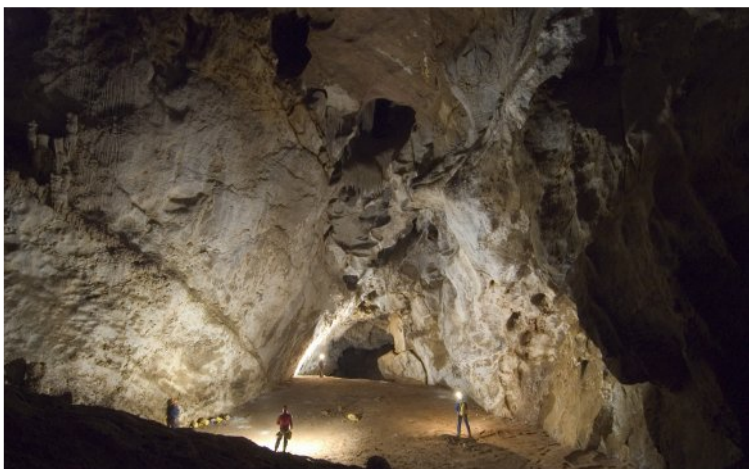
La salle de la Borne.

Le gouffre de Bechanka est un site d'intérêt international en matière de chauves-souris. Il est le refuge d'une colonie d'environ 1500 rhinolophes euryals ainsi que de nombreux grands rhinolophes. Veuillez prendre la peine de lire les deux panneaux, situés en bas du puits d'entrée et à l'entrée de la salles chauves-souris, pour vous informer de la conduite à tenir afin de ne pas déranger les habitants des lieux.