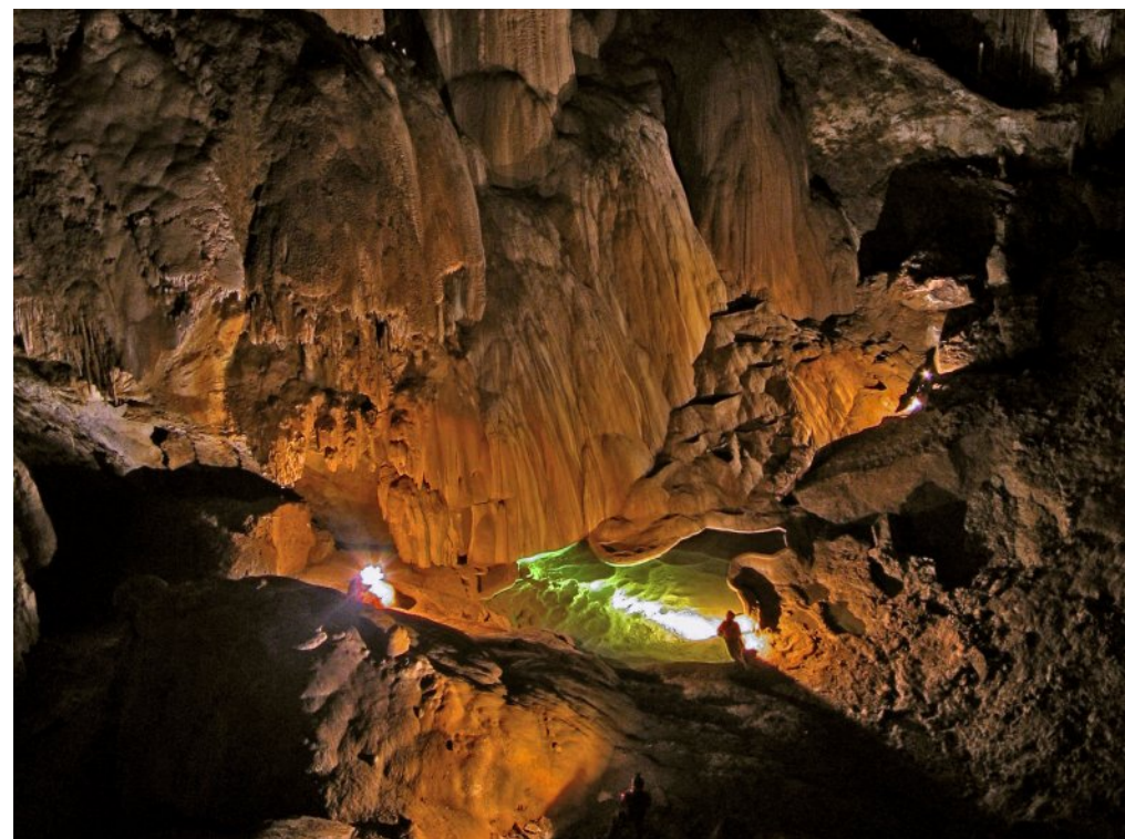
La salle du Gour Géant.

La visite du gouffre Bechanka nécessite de signaler sa présence dans le registre qui se trouve au bar "Chez Aguer" à Camou-Cihigue.